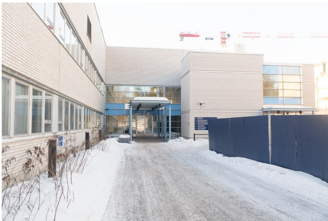
Karvasbackavägen 10 C