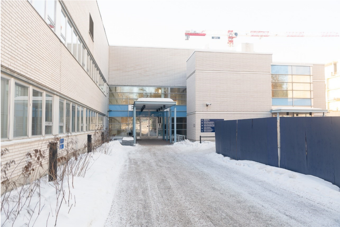
Karvasmäentie 10 C