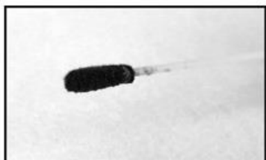
Rätt mängd avföring