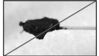
كمية مناسبة من عينة البراز