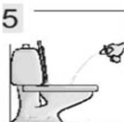
5 Испустите мочу сначала в унитаз.