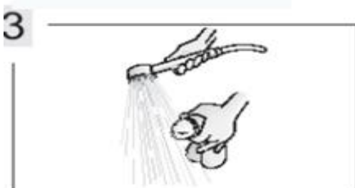
3 Промойте под струей воды мочевыводящее отверстие.