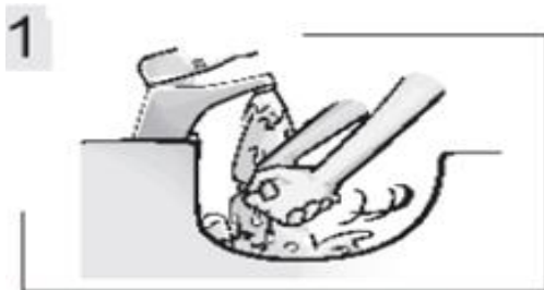
1 Помойте руки.